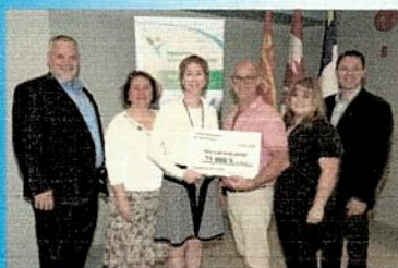
Campagne – inauguration