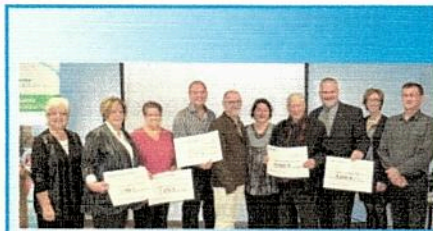
Campagne – lancement