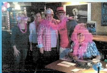
Radiothon des Roses