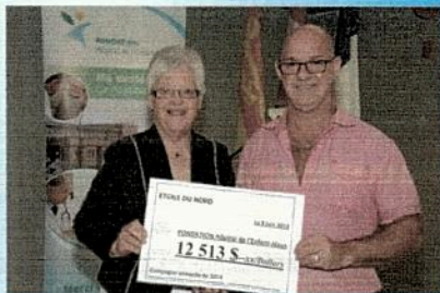
Étoile du Nord