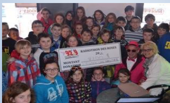
Radiothon des Roses