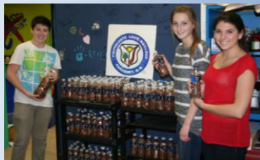
Étoile du Nord